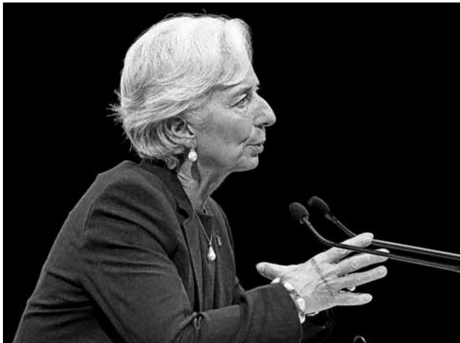
Christine Lagarde, directora gerente del FMI.

En este difícil escenario, el organismo abrirá su cumbre de otoño la próxima semana. Como aperitivo, ayer publicó dos capítulos del informe de perspectivas, donde sugiere a los bancos centrales que hagan “caso omiso” de las subidas del nivel general de inflación como consecuencia de las materias primas, justificando que la política monetaria “puede seguir siendo acomodaticia”.