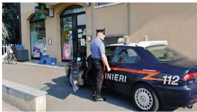
Carabinieri davanti alla farmacia di Bariano dopo la rapina