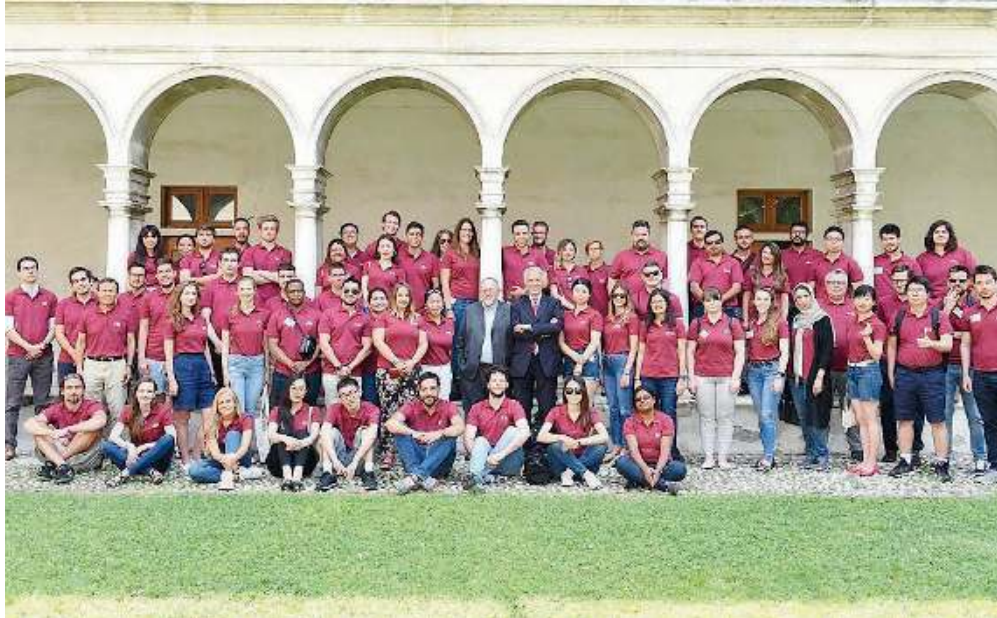
Il gruppo. Gli studenti della Iseo Summer School arriveranno da 38 università internazionali

Intitolata «The post pandemic world economy» (L'economia mondiale dopo la pandemia), la cinque giorni di studio si addenterà nei temi della ripresa economica (Stiglitz), delle nuove disuguaglianze economiche, sociali e